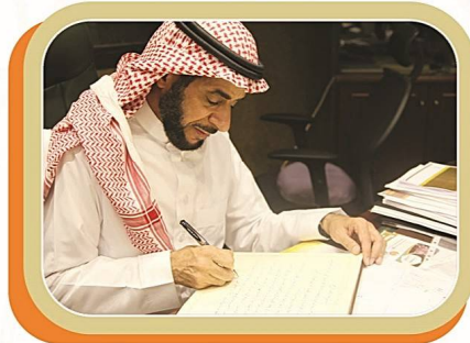
أخوكم/ خالد بن محمد الرميح مدير عام إذاعة القرآن الكريم

و كان المستوى جداً رائع و خاصة برنامج التميز الذي لفت انتباهي و لا شك أن هذه الجهود المباركة مكتوبة عند الله عز وجل . لقد أعجبتني و سرني هذه النشاطات في هذه الجمعية و ما تقدمه من خير للطلاب و الطالبات ، أسأل الله لكم جميعاً التوفيق و السداد و أن يبارك بجهودكم و يجعلها في ميزان حسناتكم .